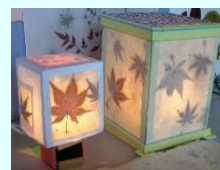
右の大きな方が大人用 左の小さな方が子供用