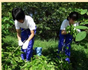
桑の葉をとって利用の実習