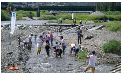
夏の市民参加の水生生物調査の定点でもある

天竜川との合流部の横川川では、毎年、夏休み中に「天竜川上流水生生物調査」が開催されます。横川川の最下流ですが、渓流性の生き物が多く見られ、渓流魚のアマゴや水生昆虫のオオヤマカワゲラなどは、天竜川に流れ込んで天竜川でも生活しています。この合流部は人々の賑わう場所で、春から秋頃まで大型のアマゴ・ニジマスやアユを求めて釣り人姿が絶えません。