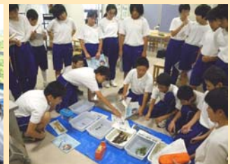
天竜川の水生物の実習

【飯田市・天竜川の岩石】と【天竜川の水生物】の2グループに分かれて、9月5日にかわらんべで学習しました。岩石では天竜川の岩石標本を作製して、伊那谷の成り立ちや地史について学びました。水生生物では水生昆虫の種類の見わけを双眼実体顕微鏡で実習し、河川生態系の「食べる・食べられる」の関係を実物で確認しました。