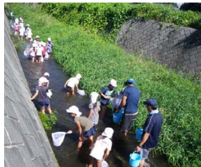
地域の身近な川【大泉川】で生き物しらべ

8月28日には南箕輪小学校4年2組のみなさんが、地域の身近な川にすむ水生昆虫と水質を調べたいとのご要望から、上伊那郡南箕輪村の大泉川に出張して講座を運営しました。