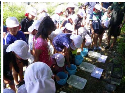
様々な生き物を見て・触って 感動