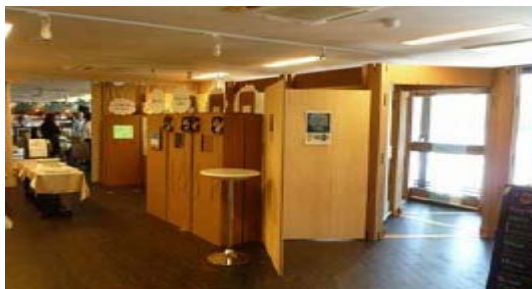
巡回中の他の会場での展示の様子

今回、その豪雨についてしっかり知っていただくため、巡回企画展を開催いたします。この企画展では「ゲリラ豪雨の発生から収束」について学校帰りの小学生の行動をたどるストーリーで、「雨の降る仕組み」「ゲリラ豪雨の影響」「身を守るためのポイント」を図解や映像で解りやすく展示してあります。社会科で自然災害を学習する小学校5年生にはぜひ体感いただきたい展示です。