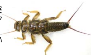
オオヤマカワゲラ

天竜川との合流部の横川川では、毎年、夏休み中に「天竜川上流水生生物調査」が開催されます。横川川の最下流ですが、渓流性の生き物が多く見られ、渓流魚のアマゴや水生昆虫のオオヤマカワゲラなどは、天竜川に流れ込んで天竜川でも生活しています。この合流部は人々の賑わう場所で、春から秋頃まで大型のアマゴ・ニジマスやアユを求めて釣り人姿が絶えません。