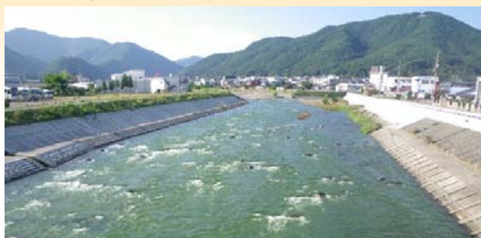
城前橋から上流の風景:写真中央左から横川川が合流する

横川川は、天竜川に合流する最初の大いなる支川です。横川川が合流して天竜川の流量が増加し、狭い流れから天竜川らしい広い流れが始まります。同時に水質、生物も変化します。これは横川川の透明できれいな水が流れ込むためです。また、ここから下流は、川の管理が長野県から国土交通省に代わる場所でもあります。