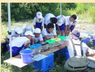
天竜川の魚・水生昆虫の採集と観察

魚と水生昆虫は、地域の身近な川で生き物を採集・観察・記録し、餌の分析や水質なども調べ、さらにザザムシの佃煮作りも体験しました。植物では、桑の有効性について、桑の実ジャム、葉の天ぷら、染め物、紙すきなどを通じて学習しました。