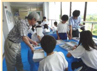
天竜川の岩石の実習