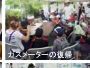
カスメーターの復帰