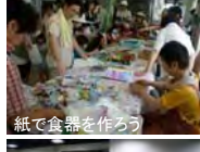
紙で食器を作ろう