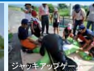
ジャッキアップゲーム