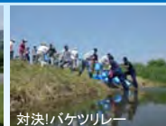
対決!バケツリレー