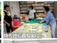
持ち出し品なあに