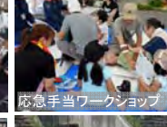
応急手当ワークショップ