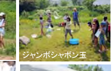
ジャンボシャボン玉