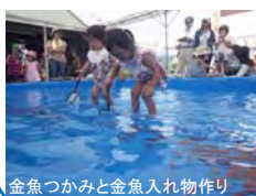
金魚つかみと金魚入れ物作り

現在、館内では祭りの様子の写真展と、祭り当日の展示コーナーを継続展示していますので、ぜひ見に来て下さい。