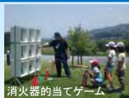
消火器的当てゲーム