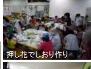
押し花でしおり作り