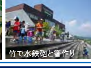
竹で水鉄砲と箸作り