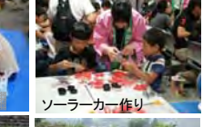
ソーラーカー作り