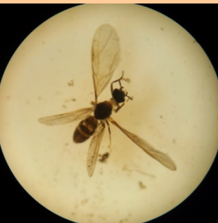
陸生昆虫、アリのなかま