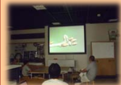
「水辺の楽校でムシ探し」 室内でスライドを使って、海外での調査の様子や、隠れているムシ探しなどを行ないました。（8/20）