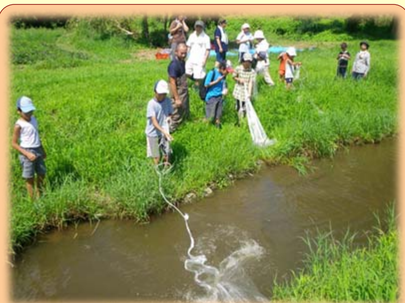
「漁師になって魚とり」 魚取りのルールを学んだあと、水辺の楽校で投網、カゴ網、タモ網を使って魚をとりました。（8/27）

かわらんべの活動報告（8月16日～9月15日）、活動予定（10月）、自然通信、SABOコラムなどをお届けします。