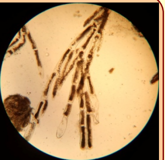
水生植物、緑藻のなかま