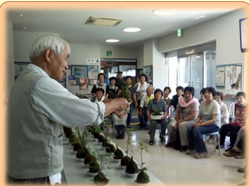
「秋の苔玉作り」 苔玉を作って鑑賞するだけでなく、苔玉の材料、作り方、その後の手入れまでいねいに教わりました。（9/15）