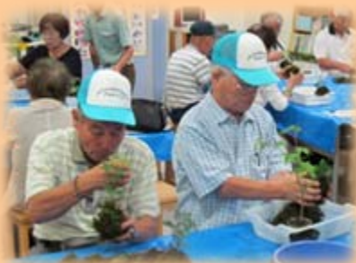
左上:苔玉作りの体験

南信地区の自然探勝会がかわらんべで行われ、草花を使った遊びや苔玉作りを体験し、天龍峡や天竜川の自然について学びました。