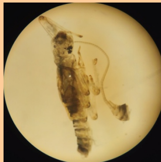
水生昆虫、カゲロウのなかま

ユスリカ、カゲロウ、など川の中に住んでいる昆虫だけでなく、巻貝、藻類、植物片、陸上の昆虫、ダンゴムシなどいろいろなものを食べていることを知りました(9/10のかわらんべ講座より)。