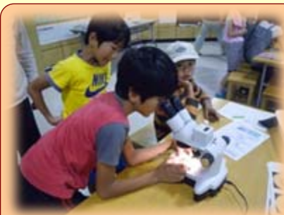
「魚の食べ物を調べよう」 カワムツ、ヨシノボリ、ドジョウなどのお腹を開き、何を食べているのかを調べました。（9/10）