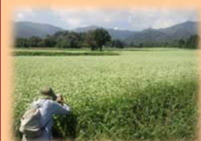
「写真講座」 下條村陽阜のソバ畑に行き、見渡す限り広がる白い花と周囲の風景を撮影しました。（9/14）