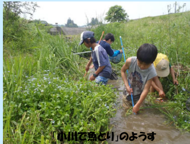
「小川で魚とり」のようす