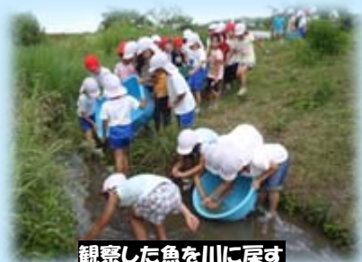
観察した魚を川に戻す

総合的な学習の時間（自然部門）でかわらんべを利用することにし、この日は、これから研究する魚や水生昆虫、石などの材料を採集しました。