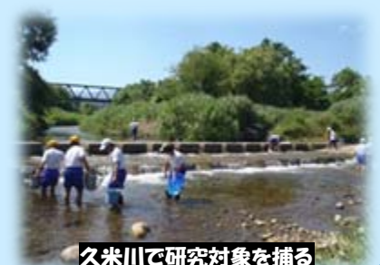
久米川で研究対象を捕る