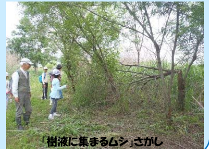
「樹液に集まるムシ」さかし