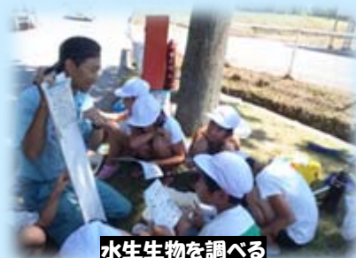
水生生物を調べる