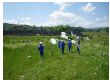
三穂小学校3・4学年(5/16) 草むらと小川の生き物観察