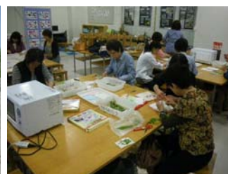
なでしこの会(5/25) 押し花しおり作り