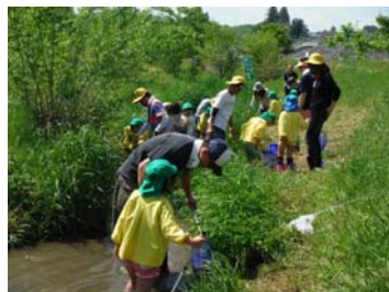
時又保育園(5/16) 魚とり・押し花しおり作り