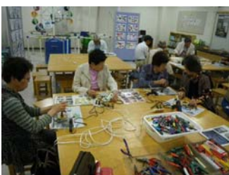
杵原応援団(5/20) 木のみアートの指導方法