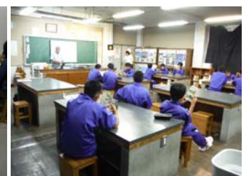
竜峡中学校(6/6) 【竜峡タイム】の学習計画