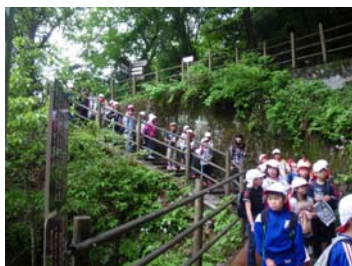
豊丘南小学校4学年(5/15) 天龍峡の自然と三六災害