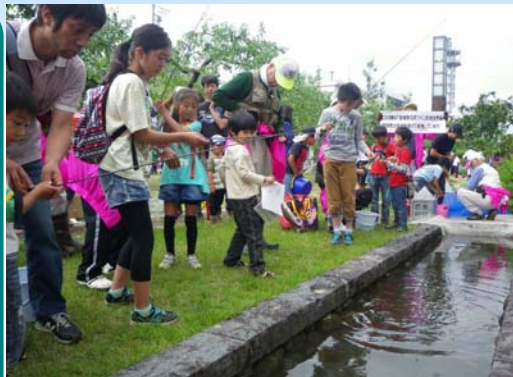
写真上: リンゴ並木の特設釣り場で親子がマス釣りを堪能。 写真右上: 特設プールでのマスのつかみ取りは大賑わい。 写真右下: 釣りたてのマスを炭火で焼いた塩焼きをその場で頬ばる。