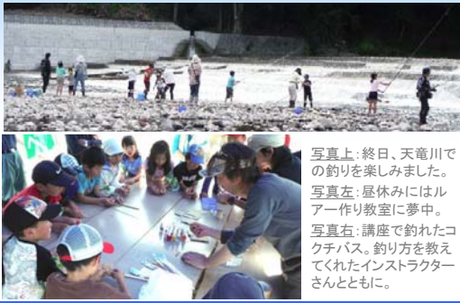
写真上: 終日、天竜川での釣りを楽しみました。 写真左: 昼休みにはルアー作り教室に夢中。 写真右: 講座で釣れたコクチバス。釣り方を教えてくれたインストラクターさんとともに。