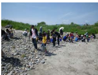
龍江小学校1学年親子(5/24) 石ころアート