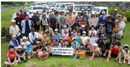
写真上: 友釣りを体験した参加者とスタッフ全員で記念撮影。 写真右: 夏の川といえば鮎。いい天気、いい川の状態できな釣りを楽しめました。初心者でも釣ることができ、また、全員が釣ることができて、釣り教室は大成功でした。