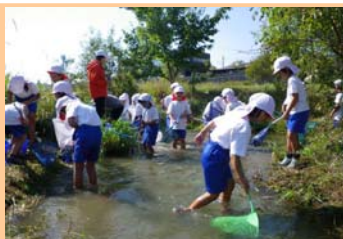
■小川で魚やザリガニとり