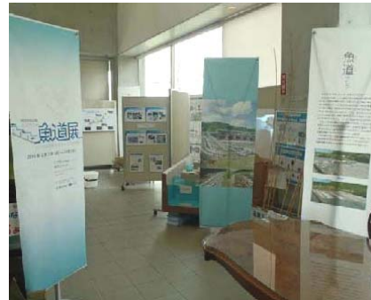
他の会場での開催の様子