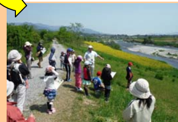
■自然体験・自然観察