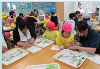
■押し花しおり作り