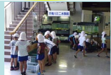
■水族館の生き物観察

参加人数が30名以上の場合は、全体を2班に分け、 2つのプログラムを交互に楽しむことができます