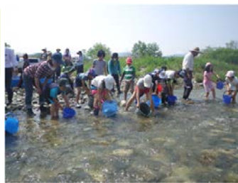
鮎の放流体験・川や生き物観察