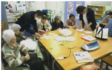
ツクイ飯田ディサービス(4/10)