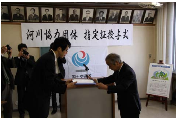
指定証を受け取るかわらんべ館長(平成26年3月19日)

今後も、講座の充実や防災意識啓発などを、地域のみなさんと共に取り組んでいきます。