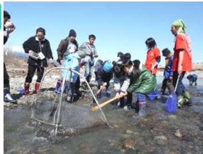
専用の漁具を使ってザザムシ漁の体験

館内に戻ってザザムシ佃煮をつくって種類ごとに味比べをしました。感想を聞いてみると昔のザザムシの「カワゲラ」が一番おいしかったようです。