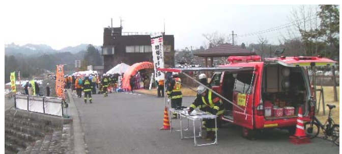
演習の現場指揮本部