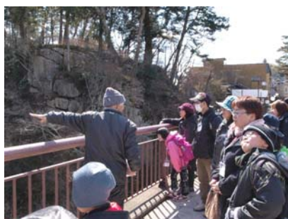
天龍峡での植物観察