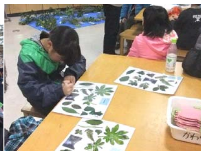
常緑樹の図鑑づくり