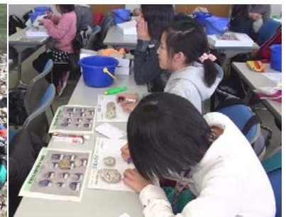
拾った石で岩石図鑑づくり

*このコラムの写真はイベント主催者の「ゆるっと赤シャツワークショップ」に提供いただきました