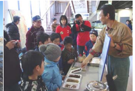
ザザムシ佃煮を作って食べて