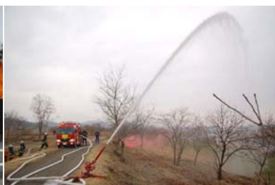
消火訓練