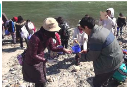
天竜川の河原で様々な種類の石探し

南アルプスから運ばれてきた石と、中央アルプスからの石では種類が違って、どこから運ばれてきたのが推理できて楽しかったですね。