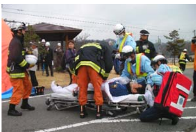
救急救護訓練